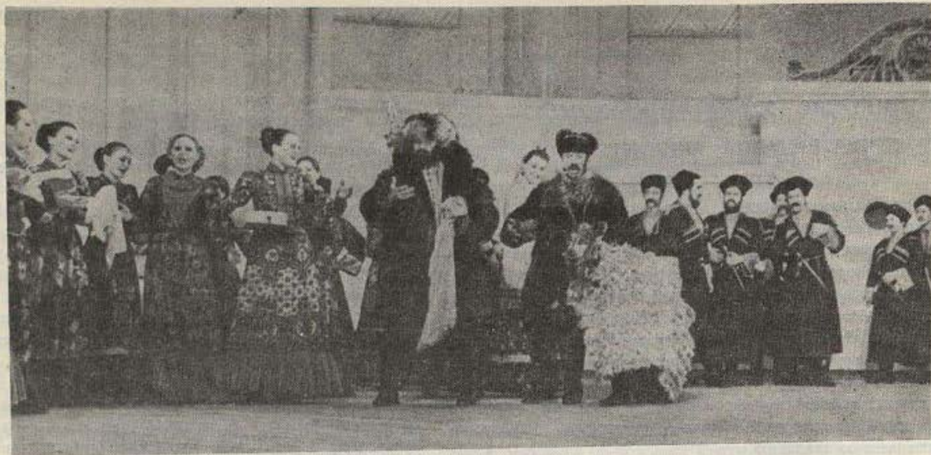
Сцену из свадебного обряда исполняет Государственный Кубанский казачий хор

коллективов — Хора имени М. Пятницкого и Хора русской песни Гостелерадио — по освоению современного репертуара. Первый из них исполнил в заключившем смотр концерте произведения в жанре народного хорового исполнительства, связанные с героической историей народа, посвященные 60-летию образования СССР, подвигам советских людей в годы Великой Отечественной войны, самоотверженному труду по выполнению продовольственной программы. Этот хор скоро отметит свое 75-летие. Второй коллектив тоже активно пропагандирует советское композиторское творчество. Ему под силу и крупная форма, и миниатюра. С его участием на радио прошло большое число премьер советской музыки, хор является первым исполнителем многих новых произведений.