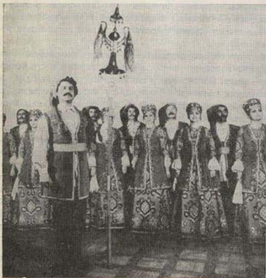
Выступает Ансамбль песни и пляски донских казаков

фольклора в его подлинном виде, с точным воспроизведением характерной манеры пения, но при этом вокальная основа, обеспечивающая полноценное качество звука, свободное раскрытие певческих голосов с их природными, естественно звучащими тембрами — нередко остается вне поля хормейстерской деятельности.